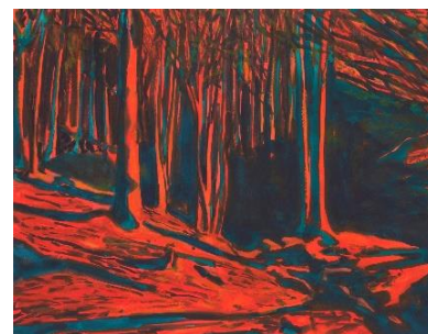
Kvällsljus, skog, 2013, akvarell

Vårens stora utställning på Vandalorum blir en solopresentation av konstnären Martin Jacobson, en av Sveriges främsta samtidskonstnärer och just nu högaktuell med sina handmålade kulisser – den största hela 16 meter hög och 9 meter bred – till Jonas Gardells nya scenshow QUEEN OF F*CKING EVERYTHING .