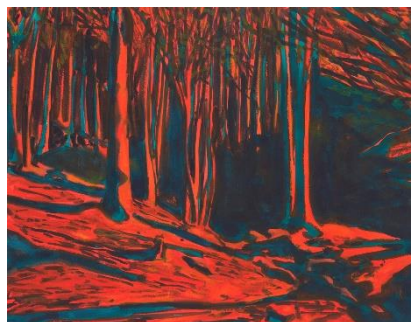
Kvällsljus, skog, 2013, akvarell